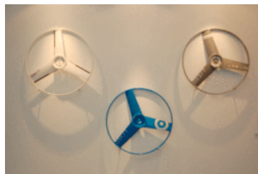
... und die dazugehörigen Propeller

"Ping meets Pong" ist neben "eine Bank, meine Bank, deine Bank" ein zweites Objekt von walking chair - die Tischtennisplatte in kreisrund, als Besprechungstisch mit Drehteller in der Mitte ebenso gut geeignet für das kleine Spielchen zwischendurch.