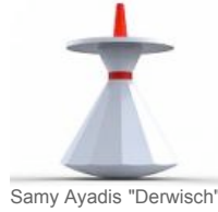
Samy Ayadis "Derwisch"

An Stehaufmännchen und Kreisel erinnern die Tischchen Derwisch von Samy Ayadi - auch diese mit tieferem Sinn: "Während ein gewöhnlicher Kreisel in dem Moment in dem er zur Ruhe kommt, jegliche Funktion verliert und nur noch Platz versperrt, verwandelt sich der Derwisch im Moment des Stillstands in einen vollwertig nutzbaren Tisch."