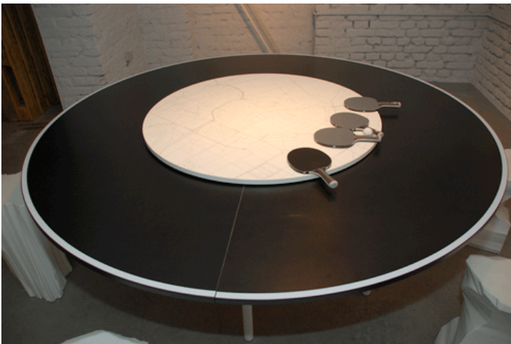
Ping meets Pong - als Besprechungs oder Eßtisch mit Drehteller...