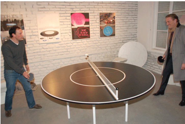
... und als Interaktions- und Entspannungsspieltisch.