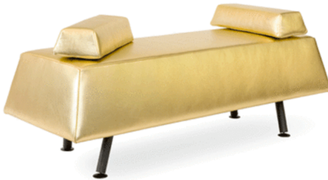
Eine, Meine, Deine Bank vom Wiener Duo walking chair

von Redaktion Detail Daily am 23.11.2010